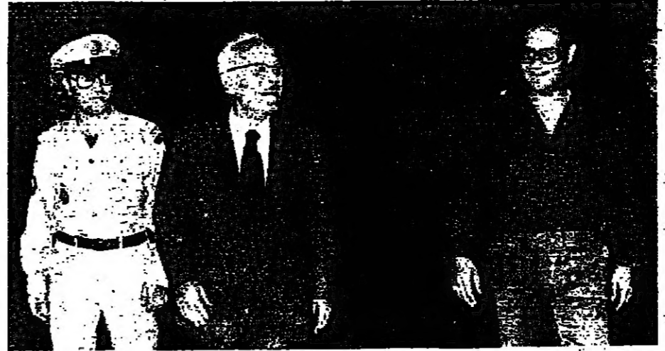
الرئيس فرنجية مع عدد من أعضاء المجلس الوطني